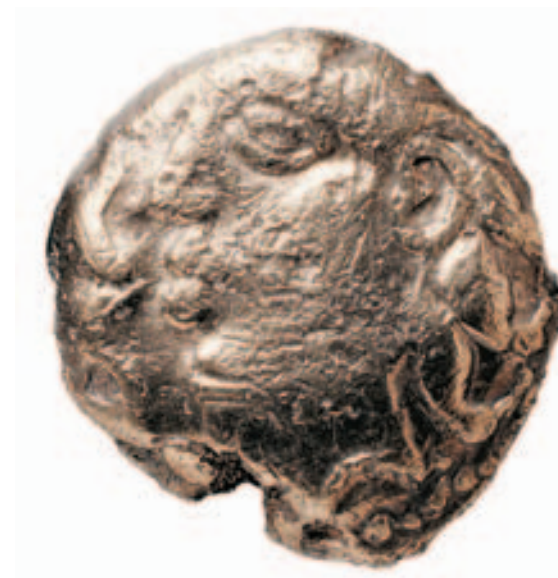
in Tarodunum hergestellte keltische Goldmünze (2. Jahrh. v. Chr.)