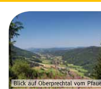
Blick auf Oberprechtal vom Pfauen

In schöner Natur, eingebettet in Schwarzwaldberge, liegt der Luftkurort Oberprechtal – ein Stadtteil von Elzach – mit 1.000 Einwohnern.